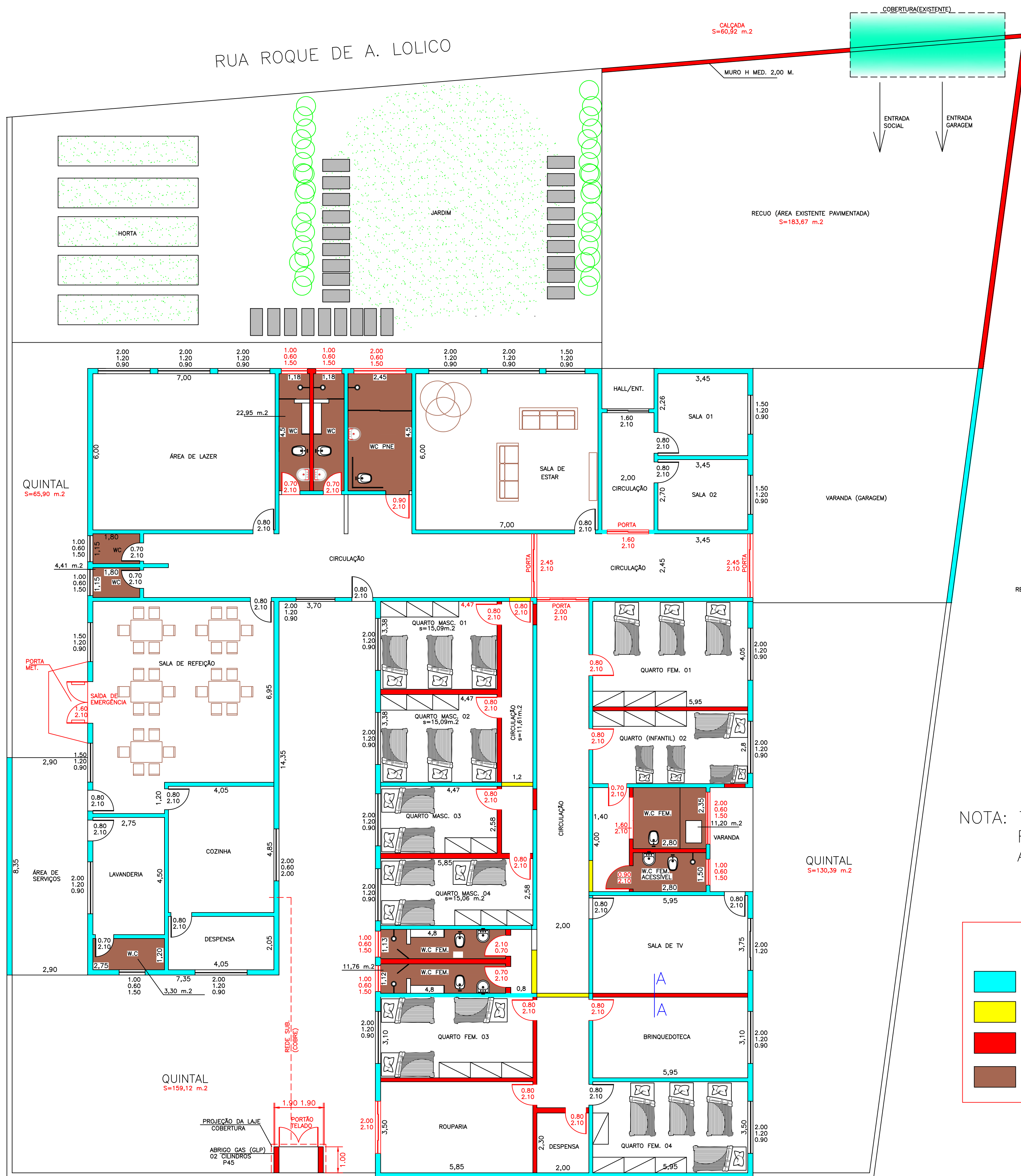
PLANTA BAIXA – 1:100